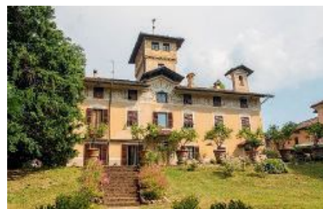
Villa Schella a Ovada tra le 5 residenze storiche aperte

L'iniziativa è all'ottava edizione: la finalità, come spiegano gli organizzatori, è «aprire al pubblico un patrimonio storico, artistico e culturale unico, affascinante e spesso poco conosciuto e sensibilizzare sull'importanza della conservazione e della valorizzazione dei beni culturali privati soggetti a vincolo, la cui tutela è affidata ai singoli proprietari». L'evento, inoltre, rientra nell'ambito della Private Heritage